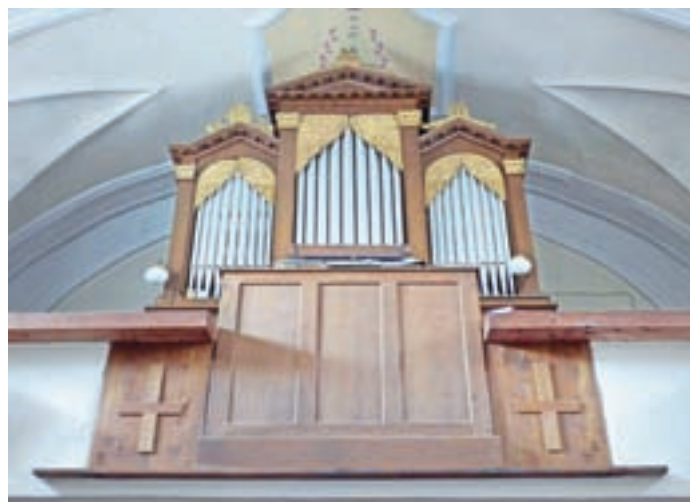
Orgle iz leta 1941 so vgrajene v ohišje Rojčevih orgel iz srede 19. stoletja.