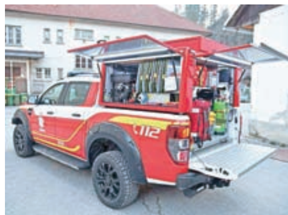
Novo vozilo gasilcev s Trebije

zimskem času, predvsem do višje ležečih hiš." To je edino terensko vozilo v občini, s katerim je možen tako prevoz gasilcev kot opreme po hribovitem terenu občine. Društvo ima še kombinirano vozilo Renault Master GV-1 in tovorno vozilo Man TGM13.290 GVC 16/25. Finančna sredstva, približno osemdeset tisoč evrov, so gasilci zbrali sami v okviru različnih delovnih akcij, veselje in z nabiranjem železa. Velik del sredstev so prispevali krajanji KS Trebija, ki so gasilce pozitivno presenetili s prispevki za novo vozilo. "Še enkrat se zahvaljujemo, saj so s tem pokazali veliko zaupanje in podporo gasilskemu društvu, nam pa zadali še dodatno motivacijo do prostovoljnega dela. Upamo, da jih ne bomo razočarali!" Uradna predaja vozila je bila načrtovana za mesec julij, a je zaradi epidemije covid-19 gotovo ne bo. "Upamo, da se bodo razmere čim hitreje izboljšale, da bomo vozilo predstavili krajanom." Za delo z