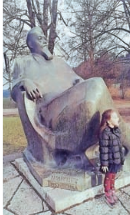
Prešernove pesmi so recitali tako mladi kot stari.

Pesmi so oživele na najrazličnejše načine in v več jezikih – med drugim tudi v francoščini in španščini. Gledalci so si lahko ogledali celo edinstveno obliko pripovedovanja zgodb ob slikah kamišibaj, pa recitacije ob posebnih ilustracijah, recitacijo ob vinu, ob spomeniku Ivana Tavčarja, v zavetju topline doma ali iz doma tretje mladosti. Prav iz zadnjih so prispele izjemno ganljive recitacije. Na povabilo so se namreč odzvali v številnih domovih za starejše, kjer so delovne terapevtke vložile dragoceni čas in motivacijo. V mladostnih spominih so Prešernove pesmi ponovno obudile oskrbovanke iz Centra slepih in