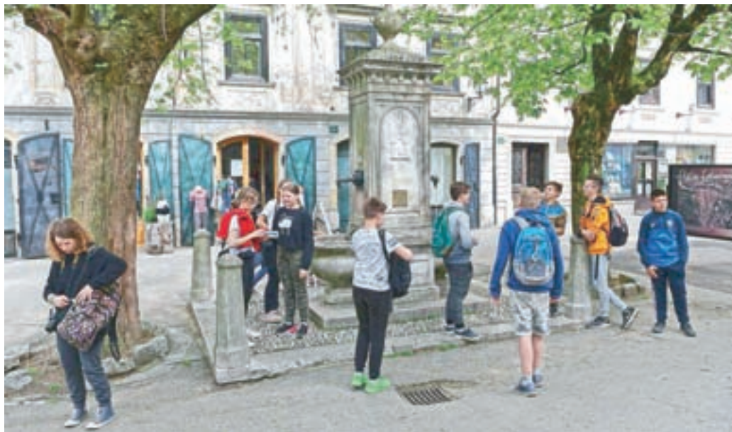
Člani fotografskega krožka v Škofji Loki

Konec januarja so se v šolske prostore vrnili učenci prve triade, tri tedne za njimi pa še ostali osnovnošolci in dijaki četrtnih letnikov. Situacija v šolah ni rožnata. Učenci so zaprti v tako imenovane mehurčke – to pomeni, da je vsak razred nekako ujet v svojo učilnico. Selijo se le za pouk likovne umetnosti, tehnike in gospodinjstva. Pogosto umivajo in razkužujejo roke, pazijo na medsebojno razdaljo, se ne dotikajo drug drugega, zračijo prostor, brez maske so samo v svoji učilnici in na prostem. V prvih urah so ponavljali in