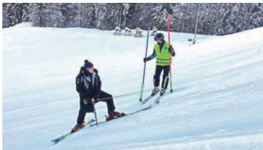
Postavljanje proge FIS Vitranc 2021

Prav zaradi prepoznavnosti in dobrih referenc je bil SK Poljane letos prvič povabljen tudi na pomoč pri organizaciji Pokala Vitranc, ki je potekal 13. in 14. marca, kar si v klubu prav tako štejejo kot veliko priznanje. Sicer je organizacija tekmovanj in njihova izvedba za smučarski klub izredno pomembna, saj to predstavlja enega od glavnih virov prihodkov kluba. Obenem se v klubu zahvaljujejo vsem sponzorjem in podpornikom, da jim je kljub epidemiji tudi z njihovo pomočjo uspelo v veliki meri izpolniti zastavljen program dela.