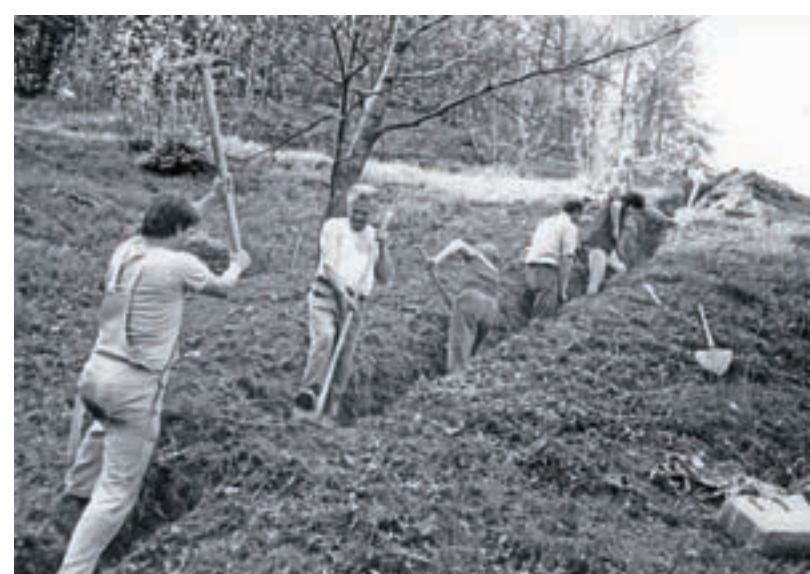
Gradnja telefonije in vodovoda v letu 1985 ...