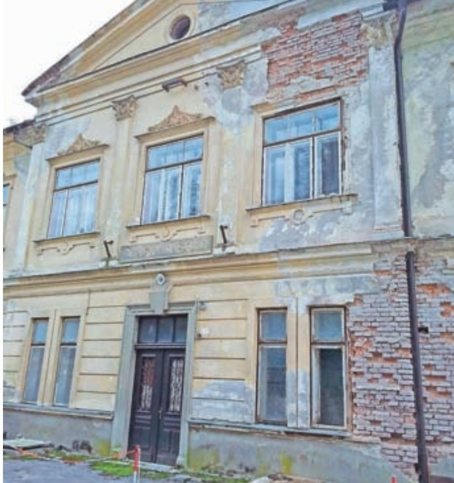
Nekdanja poljanska šola