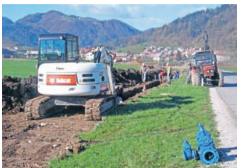
... in dvajset let kasneje.