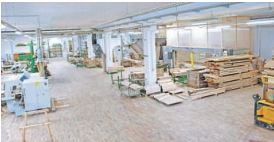
Novi proizvodni prostori

Stalne večje kupce imajo v Franciji, Angliji, Nemčiji in Izraelu, montaže v sosednjih državah opravljajo skorajda dnevno. "Na področju razvoja stopnic v Sloveniji in tudi širše orjemo ledino, zato je največja težava ta, da se nimamo od koga učiti glede uporabe novih tehnologij in detajlov, a imamo zmogljiv in učinkovit kolektiv, ki zna sprejeti izzive. Vsi skupaj stremimo k optimizaciji delovnih procesov, kar se odraža tudi v povečevanju dodane vrednosti ter vsakoletni rasti prihodkov. Lansko leto smo kljub epidemiji in razmeram na trgu beležili 17-odstotno rast," pojasni. Sredi leta bodo zaključili investicijo v nov CNC-stroj, ki bo popolnoma enak obstoječemu in bo podvojil zmogljivosti tam, kjer trenu-