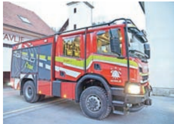
Uradni prevzem novega vozila v PGD Hotavlje načrtujejo ob praznovanju 70-letnice.

opremo za posredovanje ob naravnih in elementarnih nesrečah." Nadgradnjo podvozja Scania P410 4x4 je izvedlo podjetje GV Pušnik. Gre za prvo tovrstno vozilo tako v GPO Gorenja vas - Poljane kot tudi v GZ Škofja Loka. "Ostala društva imajo v večini vozila z oznako GVC 16/25. Glede na to, da naše društvo pokriva največji delež gozdnih površin v naši občini, vse tja do Blegoša, smo se odločili za tip vozila GCGP-1. Zdaj smo tudi mi primerno opremljeni za društva I. kategorije tako kot druga društva v občini. Obstoječe kombinirano vozilo za zdaj še ostaja v uporabi, najbrž ga bomo čez čas zamenjali za vozilo za prevoz moštva – GVM." Vrednost investicije skupaj z opremo znaša približno 240 tisoč evrov, pri čemer so iz naslova Plana GPO Gorenja vas - Poljane prejeli 82 tisoč evrov. "Razliko smo zbrali sami. Iskrena hvala vsem donatorjem, ki ste nam pomagali s svojimi