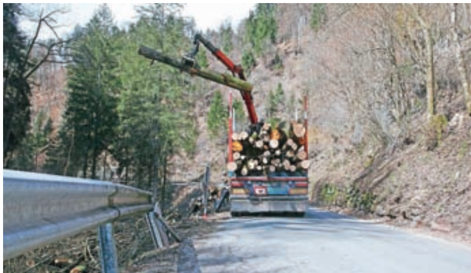
Začela se je sanacija zidov in brežin na kilometer in pol dolgem odseku državne ceste od Trebije do Hobovš.