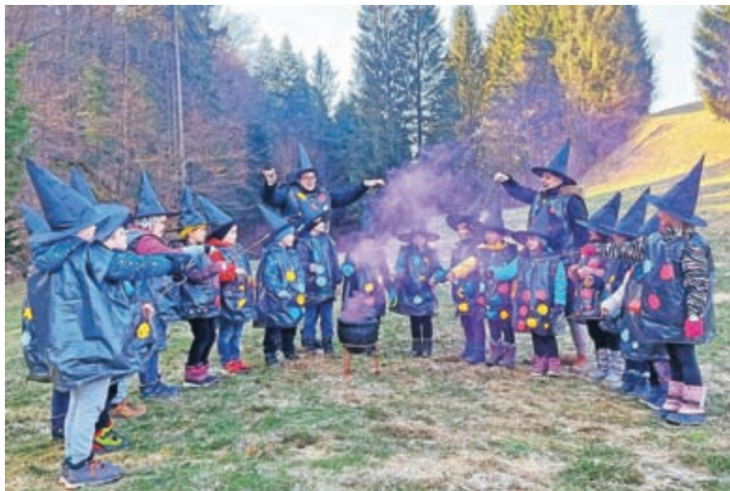
Ples maškar okrog kotla, iz katerega se je valil pisan dim