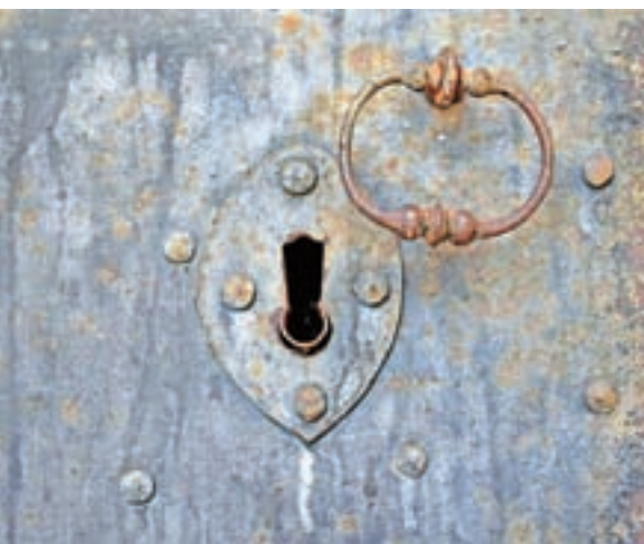
Fotografski utrinek: ključavnica na starih vratih v Piranu

V sončnih zimskih počitnicah so si šolarji nabrali svežih moči za učenje v drugi polovici šolskega leta. Upajmo, da bodo prekuženost, precepljenost in upoštevanje ukrepov zajezili epidemijo in da bo delo v šolah do konca šolskega leta potekalo "normalno" kot pred izbruhom covid-19.