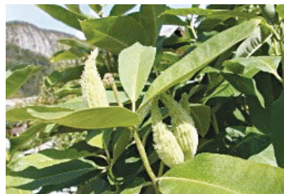
Papagajčki – sirska svilnica je na seznamu prepovedanih rastlin EU.

Prijave in dodatne informacije: jaka.subic@lu-skofjaloka.si ali 04/506 13 60.