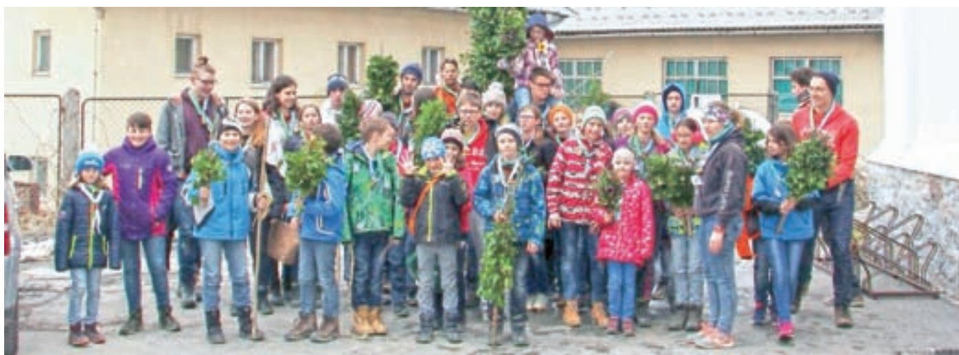
Skavti s tradicionalnimi poljanskimi zelenimi butarami pred butaro velikanko v Gorenji vasi leta 2018

Izdelava in poimenovanje butaric za cvetno nedeljo se na Slovenskem razlikuje od pokrajine do pokrajine.