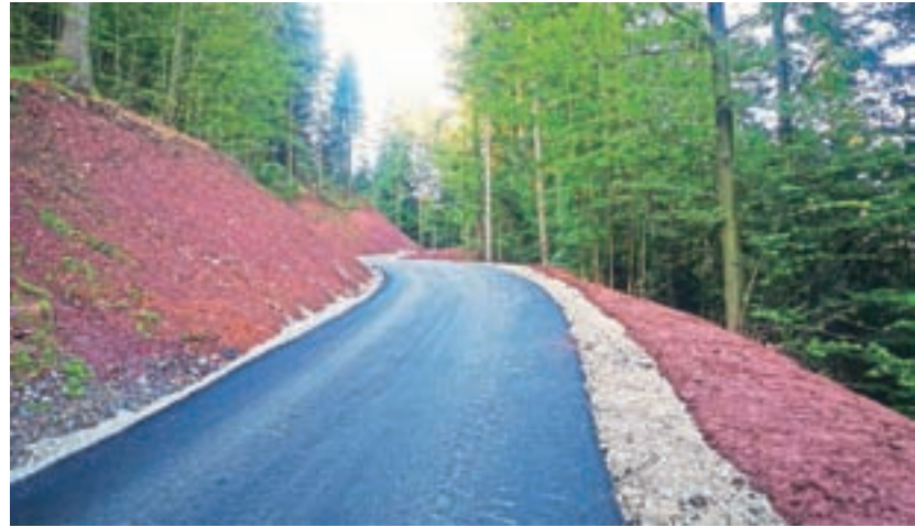
Asfaltiran odsek ceste Lovran–Vic v skupni dolžini štiristo metrov

Občina je lani pridobila gradbeno dovoljenje za razširitev parkirišča ob pokopališču v Stari Oselici, letos pa je predviden