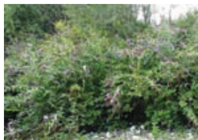
Davidova budleja – metuljnik je »tempirana bomba«.