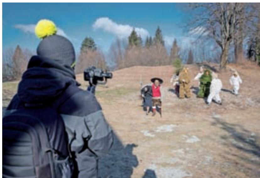
KUD Sovodenj je kulturo preselil na splet. Za pusta so z Društvom Laufarija Cerčno posneli niz video posnetkov o laufarski družini v koronskem letu.

deov, ki so prikazali življenje laufarske družine v koronskem letu. Končni izdelek je hvalevreden in KUD Sovodenj je ponosen, da je lahko sodeloval in pomagal. Poudariti gre tudi povezovanje, ki je v tem primeru za dobro stvar prešlo občinske meje," poudarja Jeram in že napoveduje letošnje projekte. "Mladost in aktivnost naših članov naš ženet naprej, zato že sodelujemo pri več projektih, vendar v manjših skupinah. Kakor nam pač ukrepi omogočajo. V delu sta dva gledališka skeča. Pri enem vaje držita v rokah izkušena režiserja Neč BAT Teatra, drugega pa poganja sila dveh nadobudnih mladih režiserjev, ki vodita prav tako zelo mlado igralsko ekipo. Luč sveta bosta skeča ugledala takoj, ko jo bosta lahko." Tretji projekt v nastajanju pa je otroška mini filmska serija, v kateri je glavni lik škrt. Po količini dela, ocenjujejo, bi projekt lahko primerjali s celovečerno avtorsko gledališko predstavo. Premiero, o kateri bodo obveščali na družbenih omrežjih, napovedujejo že za to pomlad. "Tako smo, resnici na ljubo sicer bolj na daljavo, še vedno izjemno aktivni in samo čakamo, kdaj lahko privremo nazaj na plano," sporočajo iz KUD Sovodenj.