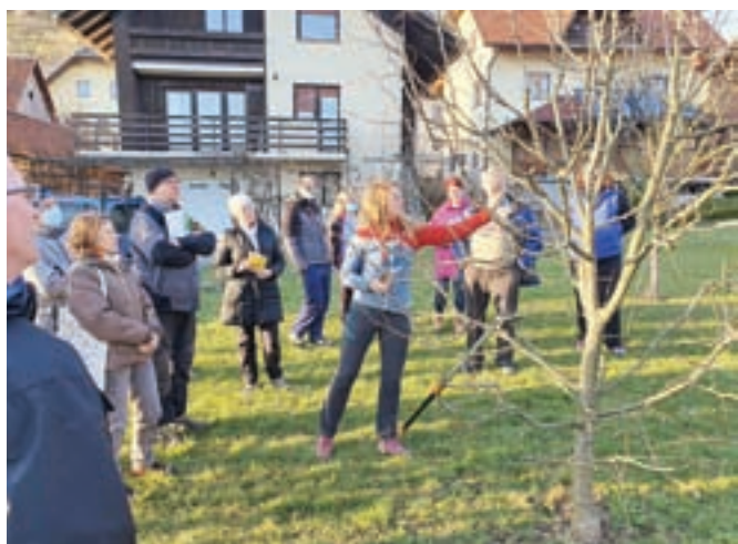
Obrezovanje sadnega drevja

Vsa izobraževanja v prvih dveh mesecih letošnjega leta v LUS Gorenja vas so potekala na daljavo in po Zoomu še vedno potekajo tečaji angleščine, španščine, nemščine in italijanščine. V Sokolskem domu pa smo že začeli tečaja kvačkanja in šivanja ter računalniški tečaj, zbrane so tudi prijave za izdelavo domačega videa. Tečaji so za občane brezplačni, financirani s strani Občine Gorenja vas - Poljane.