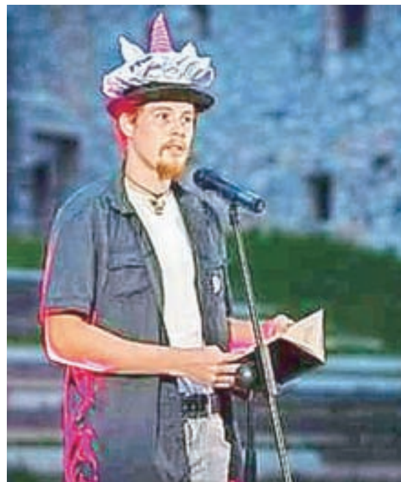
Svoje pesmi je širši javnosti predstavil na festivalu Pisana Loka.

Zbirka, ki bo izšla predvidoma aprila, je namenjena otrokom. V njej je veliko otroških pesmi z ilustracijami in pravljica. "S tem sem ne le presenetil druge, temveč tudi sebe. Gre za pravljico, napisano po pesmi Maulaj, ki sem si jo izmislil že leta nazaj," razloži 23-letnik, ki je v Poljanah poznan pod vzdevkom Pesnik. Že ko je napisal prvo pesem, ga je nekdo začel klicati Pesnik: "Tega takrat nisem jemal resno, zdelo se je smešno. Zdaj pa v Poljanah samo omeniš besedo pesnik in vsi takoj vedo zame. Včasih se mi zdi, da je to že moje ime, in zgodi se, da se tako tudi podpišem." Ljudje ga prepoznajo tudi po klobuku, ki je njegov zaščitni znak. Poleg tega ima v žepu vedno lizike, ki jih deli otrokom in ljudem, ki jih sreča: "Jaz pravim tako: Prešeren je figce talal,